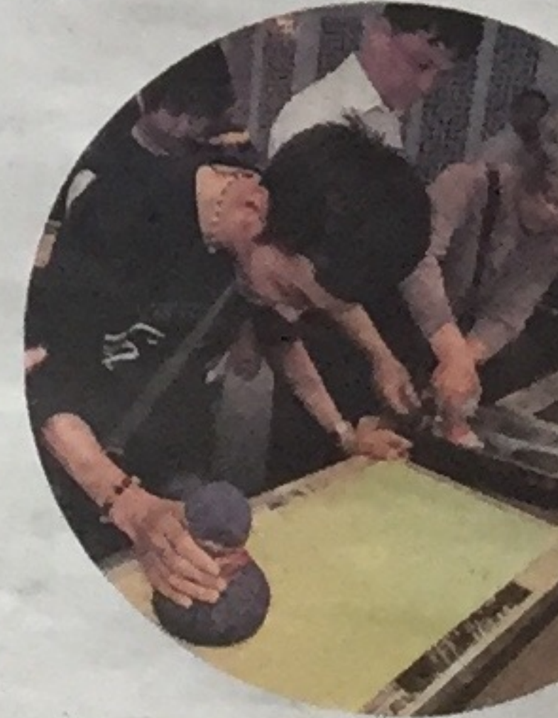
▲残疾人观众在艺术礼品博物馆参加DIY体验

本报讯(记者 孙云)“全国助残日”和“上海助残周”期间, 上海全市各界各区为残疾人献出温暖爱心, 举办捐赠、融合活动、文艺等多场助残活动。