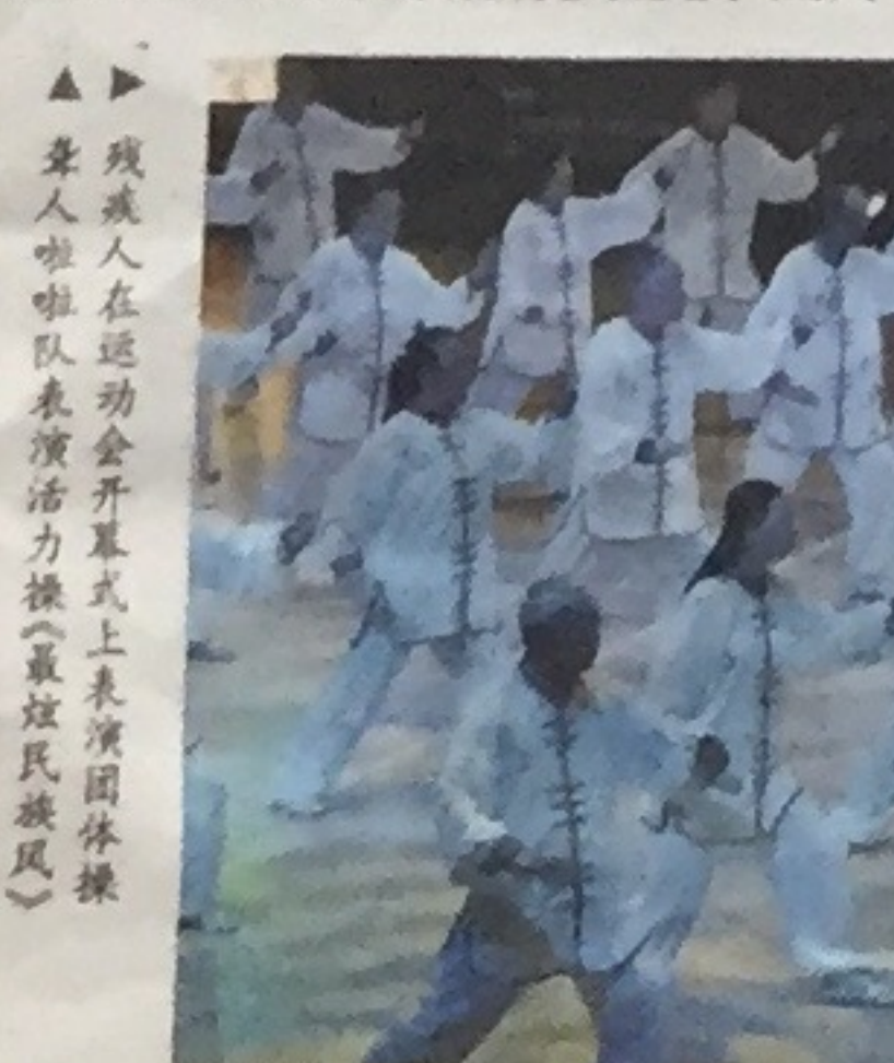
▲残疾人在运动会上开幕式上表演团体操

今天, 上海市迎接“全国助残日”“上海助残周”的主题活动——上海市第九届残疾人运动会开幕。运动会设大径路子、聋人