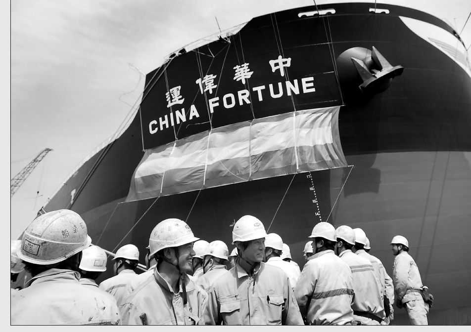
“中华伟运”命名交付。

昨天，世界新一代绿色环保型20.6万吨纽卡斯尔型散货船“中华伟运”号，在沪命名交付。这是上海外高桥造船有限公司交付给台湾著名船东中国航运股份有限公司的第五艘大型散货船。20.6万吨纽卡斯尔型散货船作为原17万吨级传统型好望角散货船的升级产品，自2009年10月正式推向市场后，就一炮打响。截至今年3月底，该船型订单已达50余艘。